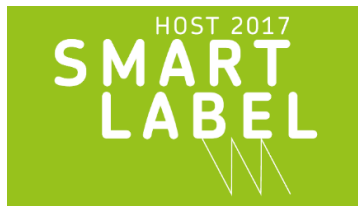
Bild 1: Winterhalter gewinnt den SMART Label Award 2017 – UC Connected Wash überzeugt die Jury der HOST