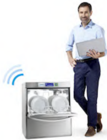
Bild 3: Die Untertischspülmaschine ist per LAN oder W-LAN mit dem Internet verbunden und sendet Maschinendaten in Echtzeit an den Server.